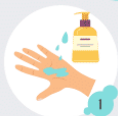
1 Utiliser du savon