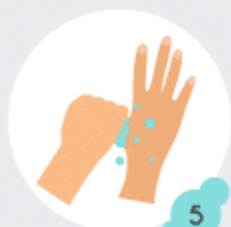
5 Base des pouces