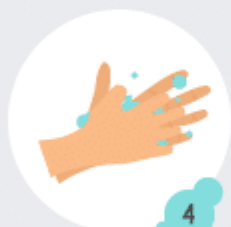
4 Doigts entrelacés