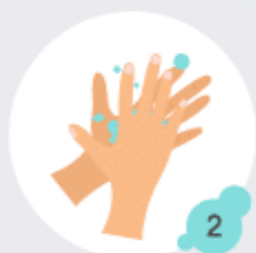
2 Paume contre paume