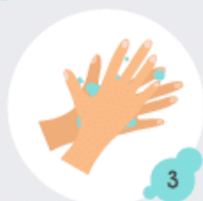
3 Dos de la main