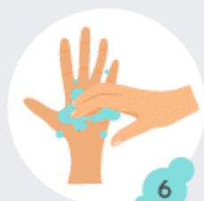
6 Ongles et articulations